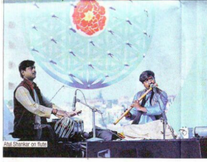
After His Correspondent

The third edition of the two-day Show Cement The Sacred, Pushkar culminated on Sunday with musical performances, meditation sessions and explorations